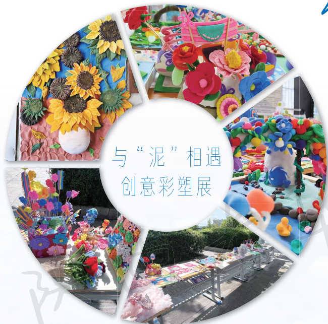
与“泥”相遇 创意彩塑展