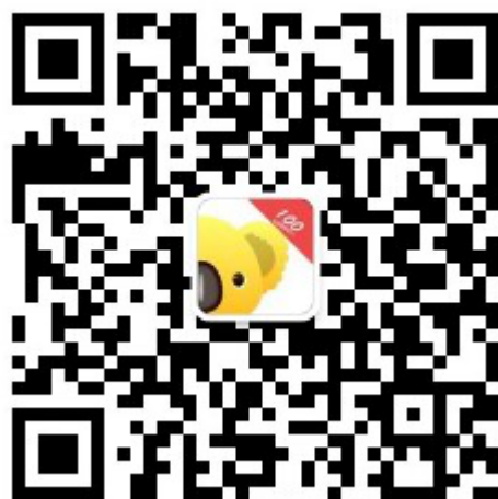
“考拉快考+” 微信公众号

学生关注“考拉快考+”微信公众号即可下载“考拉快考”App，绑定微信号即可开始模拟练习。正式比赛期间登陆信息素养大赛账号即可参加答题比赛。