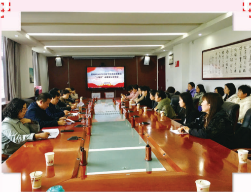
4月23日，我校举办2023年渭南市中职院校思政课程教师“大练兵”教学展示活动。（文/图薛江）

级学院负责人和高水平专业群建设项目负责人结合专业实际情况，紧紧围绕全面落实立德树人根本任务，聚焦高水平专业群建设，根据专业群的培养目标及培养特色，对于双高建设中人才培养模式创新、课程教学资源建设、教材与教法改革、教师和学生技能大赛、教师教学创新团队建设、实践教学基地和教学质量工程项目建设等方面，进行了开放性、建设性、头脑风暴式的深入交流和研讨。